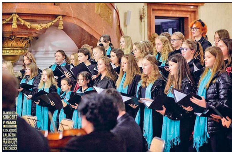
Ostravský dětský sbor.

Váhu pedagoga však neurčují dosažená ocenění, i když i z nich se všichni radujeme, ale každodenní, roky trvající práce se žákem či souborem. Mnohdy i ve skrytosti bez dlouhodobých viditelných úspěchů. Ty se dostaví třeba až za dlouhé roky v podobě tatínka, který s důvěrou přivede dcerku do sboru, na klavír nebo „do tanečků“, nebo seniorky, která se přihlásí do Akademie a vrátí se ke hře na nástroj, na nějž hrála v mládí. Tyto okamžiky jsou pro nás všechny zadostiučiněním a máme z nich kolikrát větší radost než ze zlatého pásma, protože víme, že naše práce nepřišla nazmar.