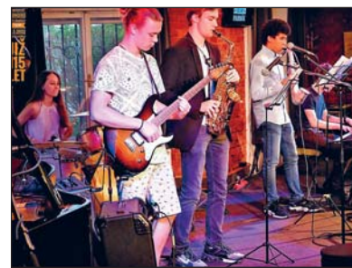
Jazztalent v klubu Parník.

pedagog. Coby umělecký šéf stál v čele Ostravského dětského sboru několik desetiletí. Svět sborového zpěvu neopustil ani po odchodu do penze a nadále působí jako člen protot sborových soutěží. Z mnohých ocenění, která za svou práci obdržel, zmíníme tato: Medaili Ministerstva školství, mládeže a tělovýchovy II. stupně za celoživotní významné pedagogické a umělecké výsledky v r. 2005 a Cenu Bedřicha Smetany za celoživotní úspěšnou sbormistrovskou činnost v roce 2012.