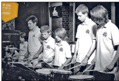
Bum Bum Band Junior.